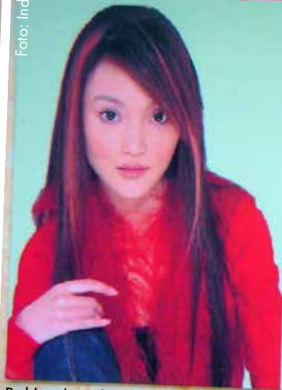
Reklamkort för prostitution i Shanghai.