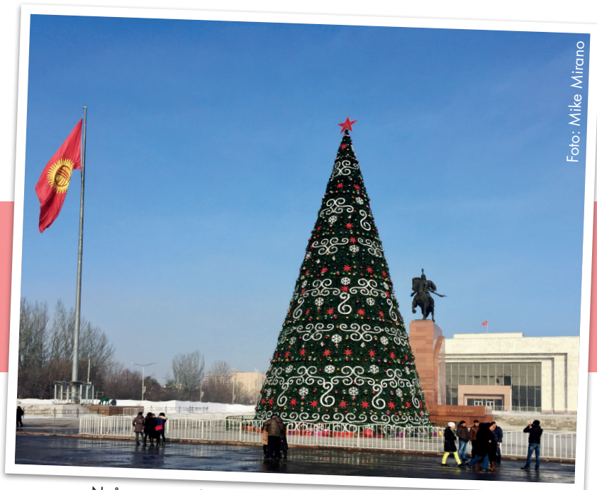
Nyårsgran på Altautorget i Krigizistans huvudstad Bisjkek.

Iran betraktas ofta som ett troligt hemland för minst en av de vise männen som besökte Jesus när han fortfarande var en liten pojke. I landet firas jul med många av de profana jultraditioner som är vanliga i väst, såsom tomtar, julgranar och julklappar. Trots höga priser säljs tusentals äkta granar. Även om de flesta av dessa faktiskt köps av muslimska familjer, så är julfirandet i första hand en sed som upprätthålls av de relativt få kristna. Julskyltning förekommer, men är vanligast i traditionellt kristna områden. I dessa områdena är det också vanligt med julkrubbor i skyltfönstren. Den största traditionella kyrkan i landet är den armeniska. Efter fasta från animaliska produkter från första december firar de julen den 6 januari, med kycklinggrytan harisa som kulinarisk specialitet.