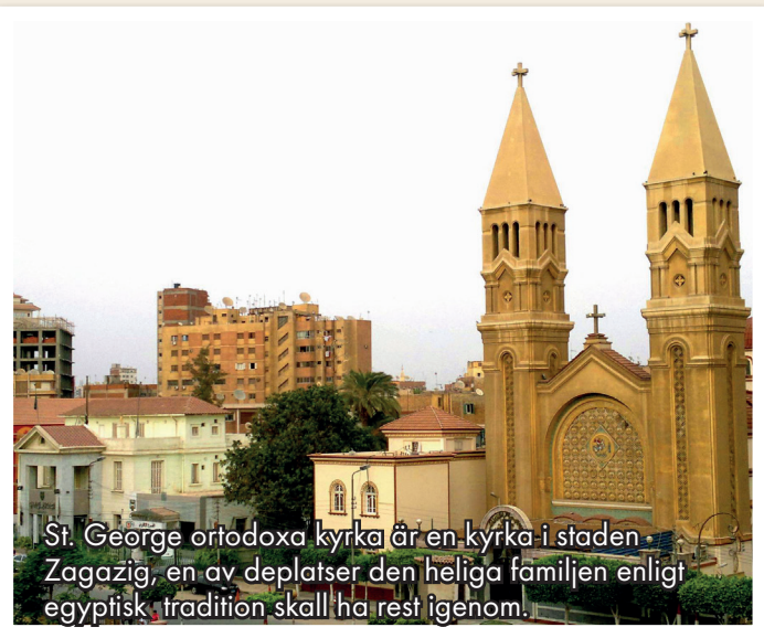
St. George ortodoxa kyrka är en kyrka i staden Zagazig, en av de platser den heliga familjen enligt egyptisk tradition skall ha rest igenom.

herdar inte var ute med sina får under vintern, november till februari. Om det stämmer, vilket det i och för sig finns utrymme att ifrågasätta, befinner vi oss på gränsen för vad som kan vara rimligt utifrån att herdarna ju faktiskt var ute och vaktade sin hjord den aktuella natten.