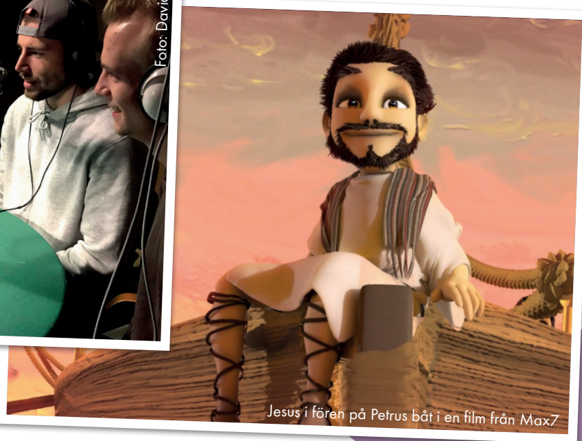
Jesus i fören på Petrus båt i en film från Max7