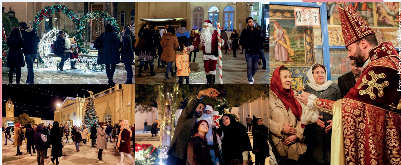
Julfirande i Isfahan i Iran 2019