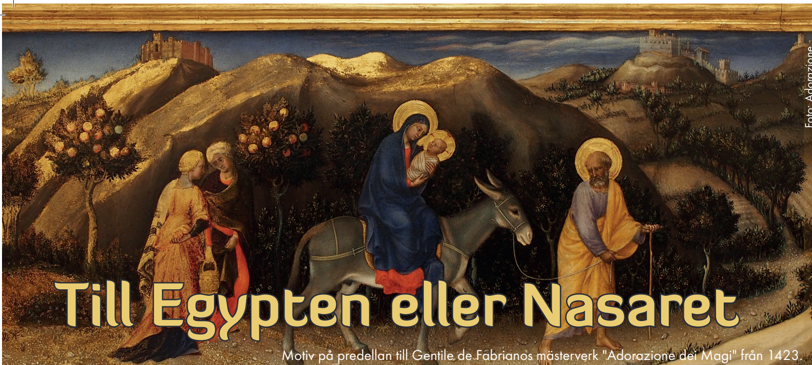
Motiv på predellan till Gentile de Fabrianos mästerverk "Adorazione dei Magi" från 1423.