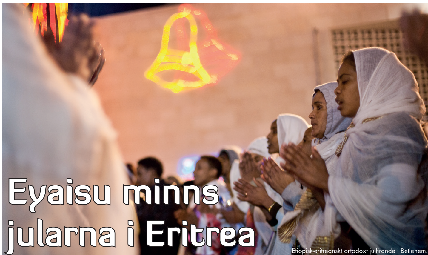
Etiopisk-eritreanskt ortodoxt julfirande i Betlehem.