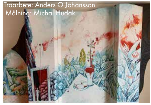
Träarbete: Anders O Johansson Målning: Michal Hudak.