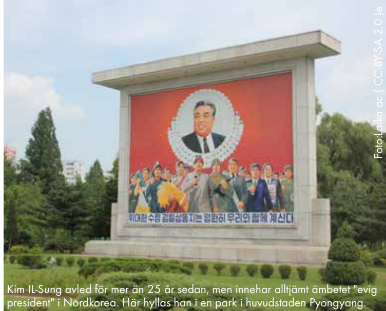
Kim Il-Sung avled för mer än 25 år sedan, men innehar alltså ämbetet "evig president" i Nordkorea. Här hyllas han i en park i huvudstaden Pyongyang.