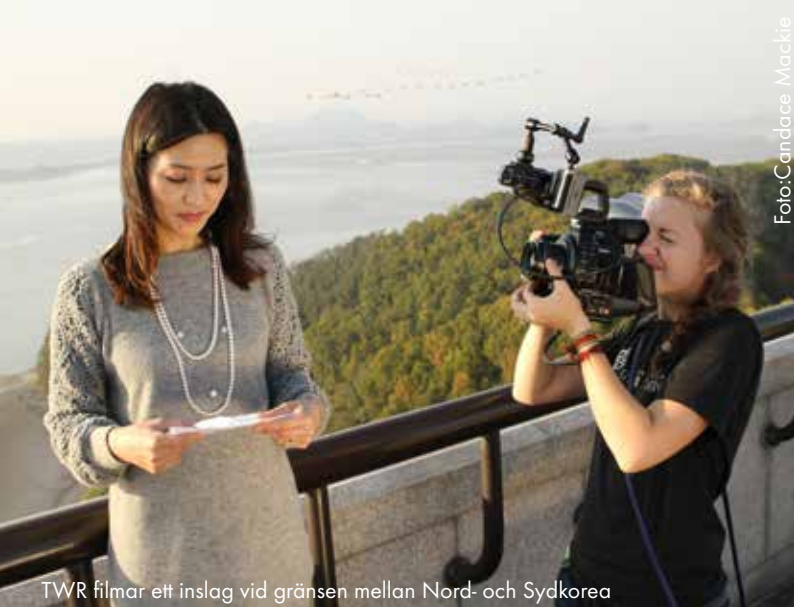
TWR filmar ett inslag vid gränsen mellan Nord- och Sydkorea